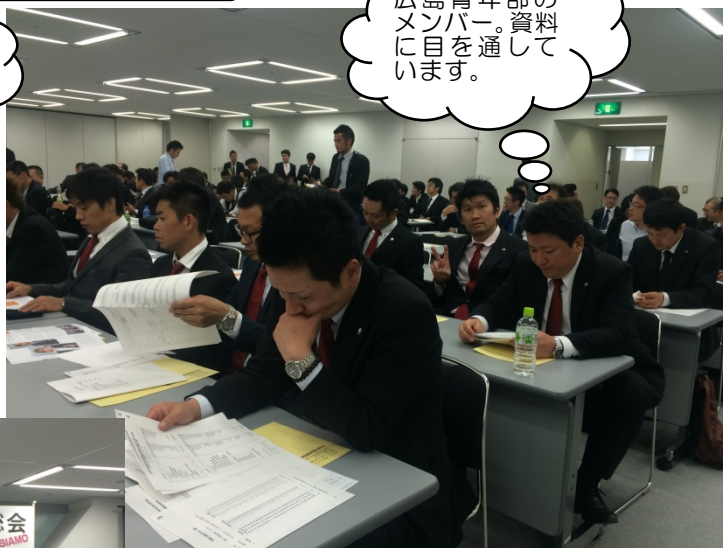
広島青年部のメンバー。資料に目を通しています。