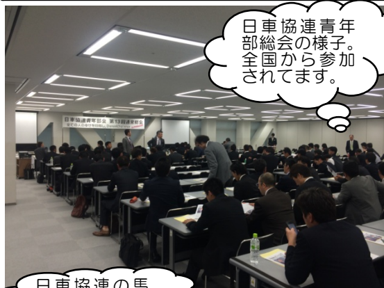
日車協連青年部総会の様子。全国から参加されてます。