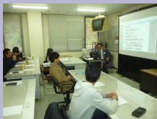
正田講師による初心者コースの研修の様子、基本を学びました。