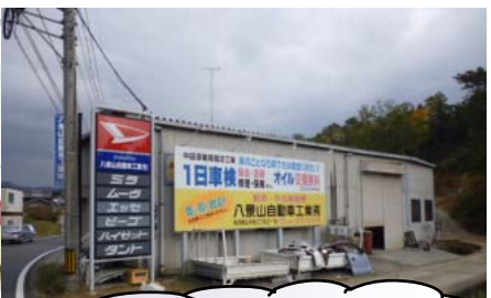
八景山自動車工業脩の钣金塗装工場です。