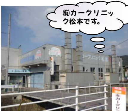
① 脩カークリニック松本です。

① 呉支部の脩カークリニック松本さんにおじゃましました。大きな工場です。川には鯉が泳いでいました。社長さんはお留守で息子さんとお話させていただきました。