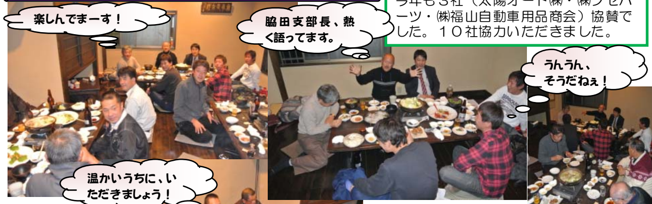
毎年恒例安芸支部忘年会!

今年も3社(太陽オート(株)・(株)フセパーツ・(株)福山自動車用品商会)協賛でした。10社協力いただきました。