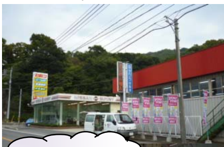
脩タワラ自動車です。

② 呉支部の八景山自動車工業脩さんの钣金塗装工場におじゃましました。ちょうど、社員の方が作業をしていらっしゃいました。ところを写真に撮らせてもらいました。町にある本社ショールームはとてもりっぱでした。